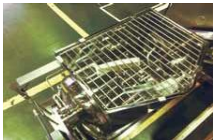
レオニーダー KH 型 (スリット状のロストル) の例