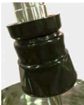
これまでのジョイント (KRS-1・KRS-2 型)