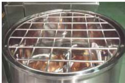
レオニーダー KQ 型 (格子状のロストル) の例