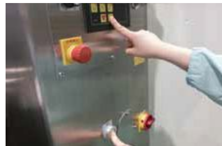
運転ボタンの両手操作 (2 点押し) の例

レオニーダー KH・KQ 型のカバーは、水分蒸発による結露という衛生問題、混合途中における材料投入という使い勝手、そして巻き込まれ防止という安全問題を同時に解決することが必要です。カジワラでは、それらを解決するために、 ロストル を開口部に設け、 ロストルが付いていないと連続攪拌しないという制御（インターロック） で対応致します。