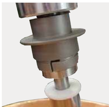
新型ジョイント（ 実用新案登録済 ）